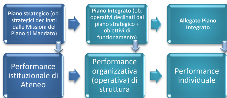
Figura 2 - programmazione a cascata

Il rapporto tra i tre livelli si basa sulla logica a cascata, o della sequenzialità programmatica: le performance istituzionali costituiscono indirizzo per le performance organizzative, le quali a loro volta costituiscono indirizzo per le performance individuali (Figura n. 2)