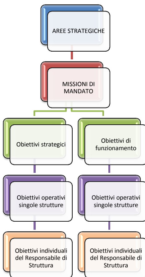
Figura 3 -albero della performance

Uno dei principi fondamentali è costituito dal collegamento a cascata degli obiettivi dell'intero ente con quelli attribuiti alle singole strutture e a quelli individuali assegnati al personale.