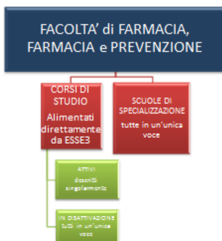
Figura 6 - Struttura Centri di Costo - Facoltà

Nell'ALLEGATO 2 vengono elencate le previsioni di bilancio (budget economico 2017) collegate ad obiettivi strategici.