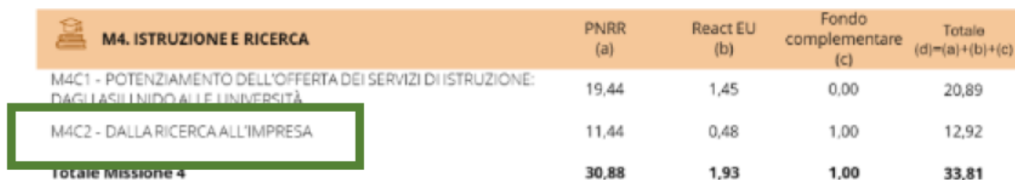
Fig. 1 - M4 Istruzione e Ricerca

Il 40 per cento circa delle risorse territorializzabili del Piano sono destinate al Mezzogiorno, a testimonianza dell'attenzione al tema del riequilibrio territoriale. Il Piano è fortemente orientato all'inclusione di genere e al sostegno all'istruzione, alla formazione e all'occupazione dei giovani. Inoltre, contribuisce a tutti i sette progetti di punta della Strategia annuale sulla crescita sostenibile dell'UE (European flagship). Gli impatti ambientali indiretti sono stati valutati e la loro entità minimizzata in linea col principio del “non arrecare danni significativi” all'ambiente (“do no significant harm” – DNSH) che ispira il NGEU ( Fonte: www.governo.it ).