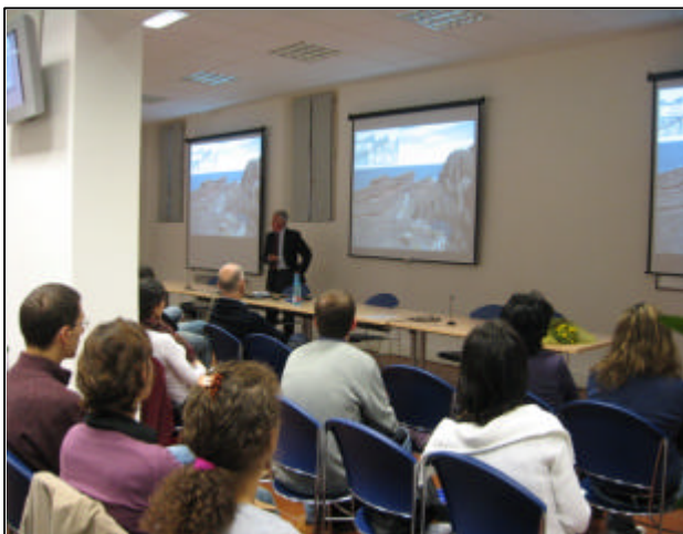
Fig. 5 Conferenze tenute nell'aula 1 nell'ambito dei Colloqui IUSS