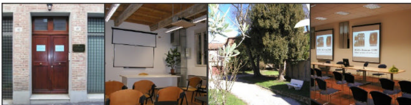
Fig.6 La sede di IUSS

Nel 2010 la sede IUSS ha ospitato convegni, incontri e seminari per ben 138 giorni, con un uso pieno della struttura.